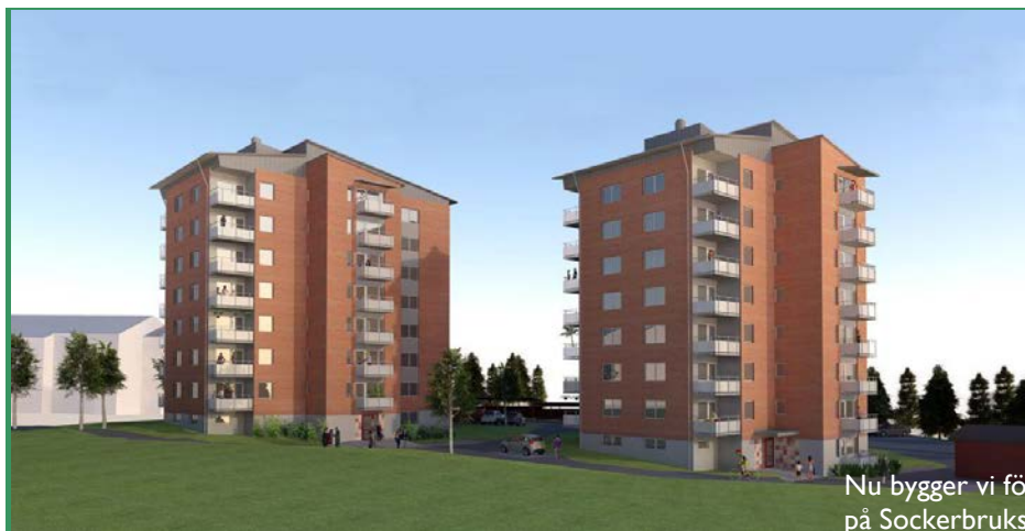
Nu bygger vi för fullt på Sockerbrukstomten. Planerad inflyttning våren 2017.